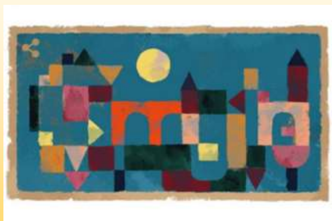
Esta obra se llama “ Puente Rojo ” en 1928.

Observa muy bien la pintura, cuenta y responde oralmente: