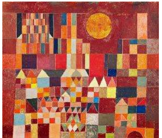
(Paul Klee 1928)

¿Qué quiso representar el artista en esta imagen? ¿A qué lugar se parece?