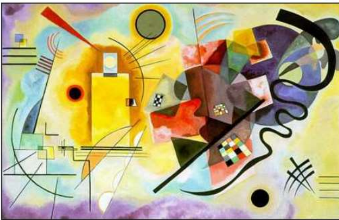
Esta obra se llama "Amarillo, rojo y azul" Autor: Wassily Kandinsky

¿Recuerdas que en clases anteriores hablamos de un pintor ruso muy famoso llamado Wassily Kandinsky, quien utilizó todos los tipos de líneas y figuras geométricas en sus pinturas?