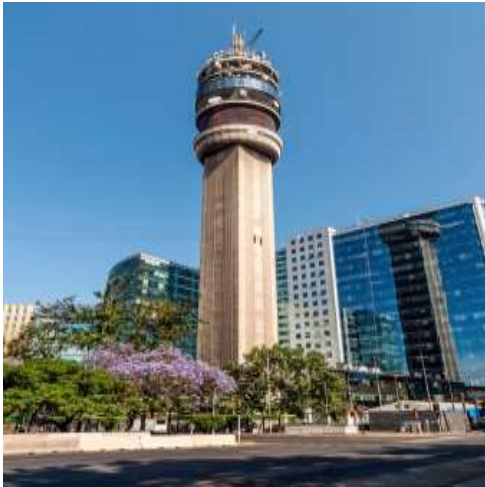
Torre Entel, Santiago, Chile.