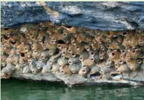
Nido de aves