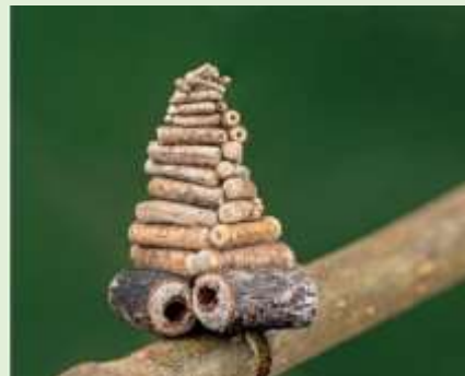
Nido de insecto