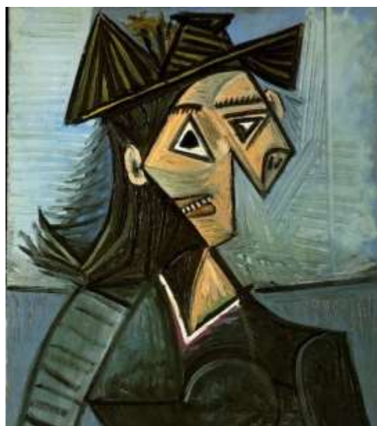
Esta obra se llama "Busto de mujer con sombrero con flores" (1942) Pablo