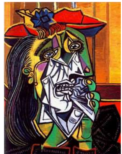
“La mujer que llora” 1937

Observa y comenta las siguientes imágenes con alguien de tu familia: