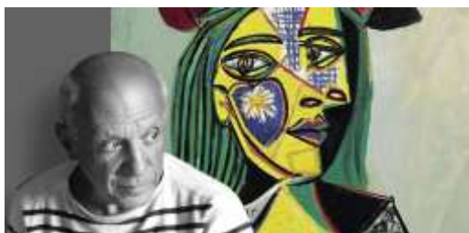
Esta obra se llama "Mujer con sombrero y cuello de piel" (Marie Thérèse Walter) en 1937 por Pablo Picasso.

Había una vez un pintor muy conocido llamado Pablo Picasso. Es considerado uno de los mejores artistas del siglo pasado. También es conocido como uno de los fundadores del cubismo. Una obra de arte es cubista cuando el artista opta por dividir los objetos y volver a armarlos en forma geométrica y abstracta (sin forma definida).