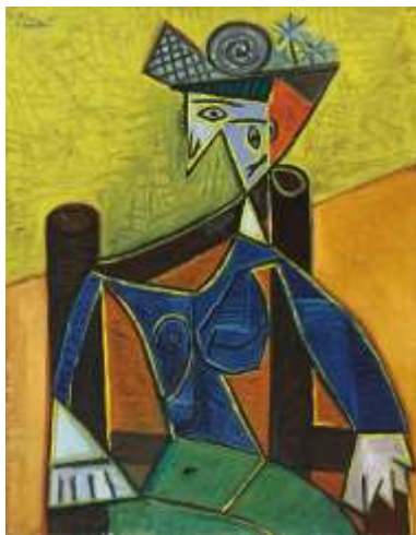
“Mujer sentada en una silla” 1937