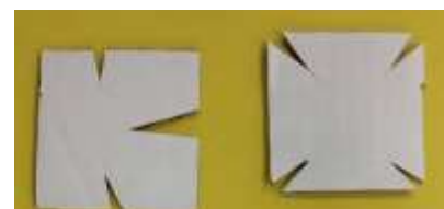
Corta por un lado o por los vértices

3.- Después de recortar, a cada pieza realiza un pequeño corte en cada lado o en cada vértice de la figura (guíate por la imagen). Esto servirá para unir las más adelante.