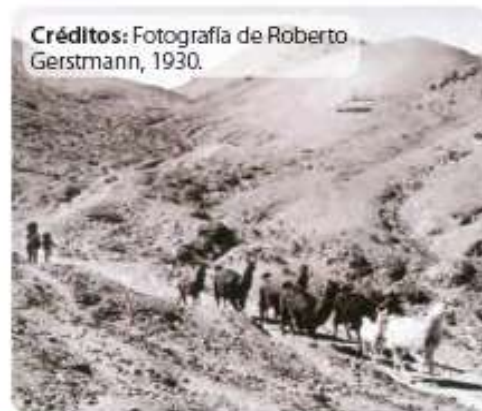
📍 Créditos: Fotografía de Roberto Gerstmann, 1930. 📍 Niños lickanantay y su rebaño de llamas hace más de 80 años. Pre-cordillera Norte Grande. 1930.