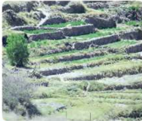
📍 Terrazas de cultivo de los pueblos originarios aymaras, lickanantay, entre otros.

3. ¿Qué podemos concluir a partir de las siguientes imágenes y el texto adjunto?