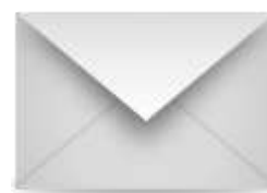
En un sobre