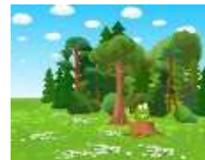
En un bosque