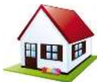
En su hogar