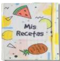
En un recetario