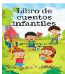
En un libro de cuentos