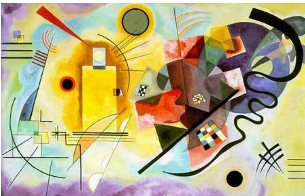
Esta obra se llama " Amarillo, rojo y azul " Autor: Wassily Kandinsk

Observa esta imagen ¿Qué figuras geométricas puedes ver en esta pintura? Menciona tres.