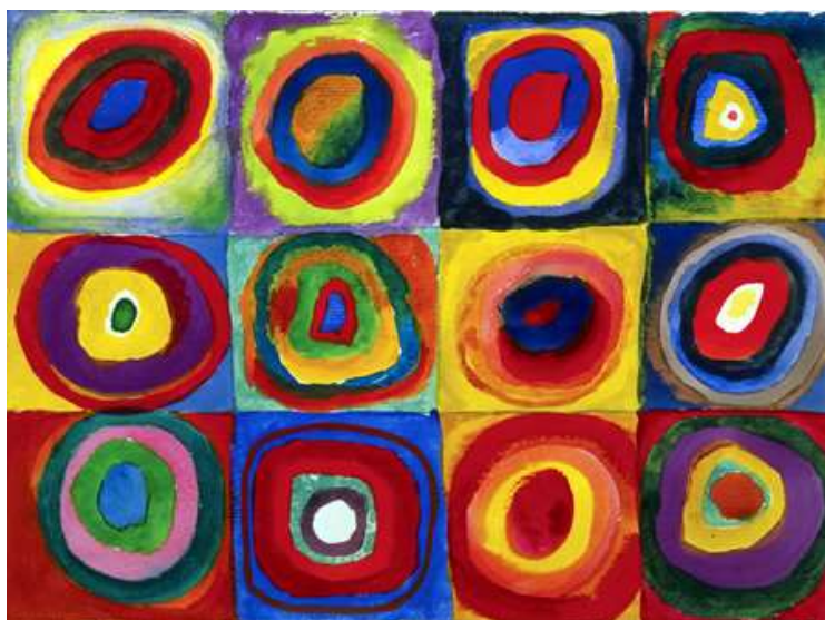
Esta obra se llama: " Estudio de color con cuadrados "