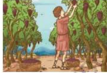
« Agricultor romano trabajando.