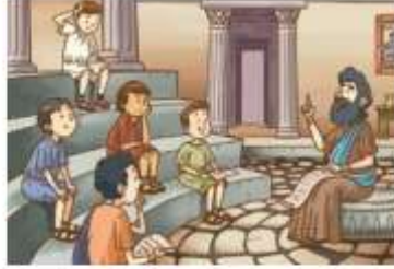
« Niños griegos en el colegio.

4 ¿Qué necesidades similares a las de griegos y romanos tienen ustedes?