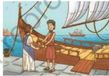
« Comerciante griego intercambiando aceite de oliva en un puerto.