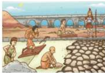
« Romanos construyendo caminos.