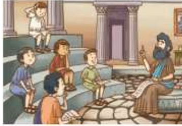
« Niños griegos en el colegio.

4 ¿Qué necesidades similares a las de griegos y romanos tienen ustedes?