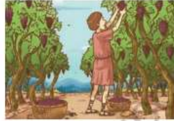
« Agricultor romano trabajando.