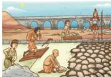
« Romanos construyendo caminos.