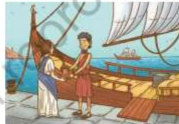
« Comerciante griego intercambiando aceite de oliva en un puerto.