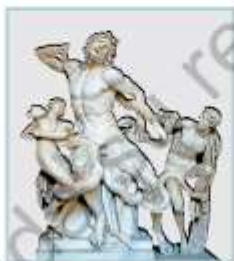
• Laocoonte y sus hijos, escultura griega.