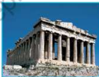
• Partenón, en la ciudad de Atenas, Grecia.

1. Copia el número de la pregunta y la alternativa de la respuesta correcta: