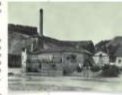
El molino de vapor de principios del siglo XIX, ubicado en Thompson Springs.