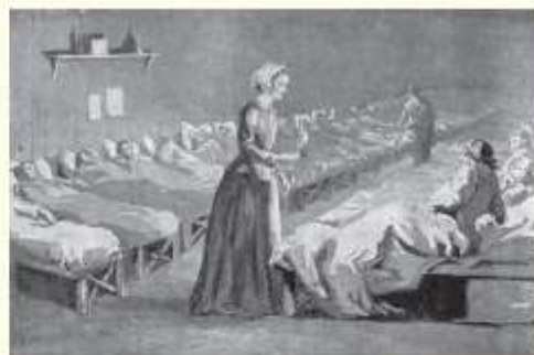
▲ Dibujo de Florence Nightingale en el hospital de Uskudar, Turquía, en la guerra de Crimea.

Varios autores. (2007). En Mujeres matemáticas . Murcia: Museo de la Ciencia y el Agua.