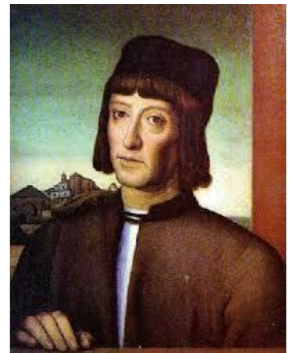
Cristóbal Colón (1436-1456)

El año 1485, Colón llegó a España para mostrar su propuesta a los Reyes Católicos y solicitar financiamiento. Pero recién en 1492 recibió una respuesta positiva por parte de los reyes, con quienes firmó las Capitulaciones de Santa Fe , que establecían los deberes y derechos de cada una de las partes respecto de los posibles territorios que descubriría la expedición.