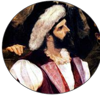
Pedro Álvares Cabral