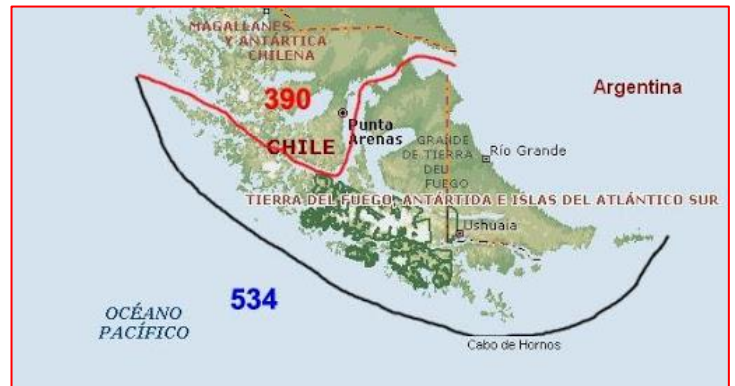
ESTRECHO DE MAGALLANES

En 1519, el rey de España encargó a Hernando de Magallanes la misión de buscar esta anhelada conexión. El 10 de Agosto de 1519, con cinco naves y más de doscientos hombres, Magallanes inició el viaje en el que descubriría el paso al que nombró Todos los Santos y que actualmente lleva su apellido.