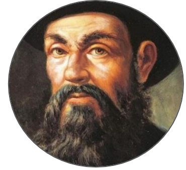
Hernando de Magallanes