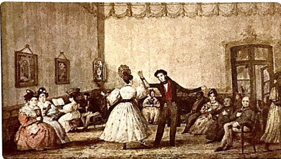
Pellegrini, C. (1834). Bailando en minué . En González, A. (1946). C. H. Pellegrini. Su obra, su vida, su tiempo . Buenos Aires, Argentina: Amigos del Arte.

2.- Observa las pinturas y luego responde las preguntas en tu cuaderno.