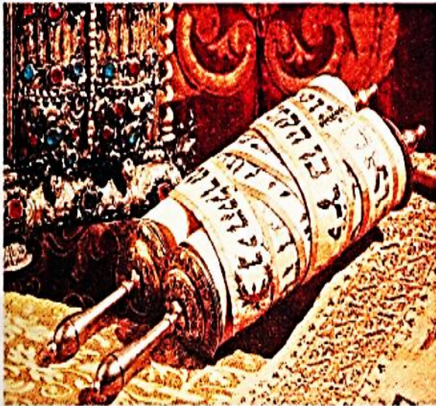
▲ La ley judía, o Torá, debía preservarse de influencias externas.

Además de la religión oficial y pública había religiones ocultas. Estas dejaban de lado la religión oficial y seguían una religiosidad privada y secreta. Sus reuniones y ritos eran secretos; los hacían para purificarse y, así, asegurar la protección de la divinidad. Estas religiones se extendieron por todo el Imperio, a pesar de que era muy difícil entrar en ellas por su secretismo y por los requisitos que se exigían.