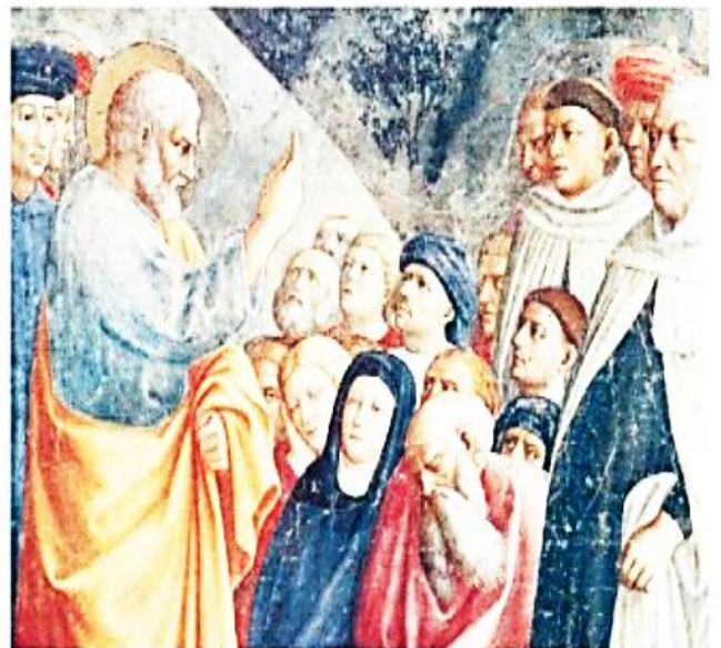
MASACCIO, San Pedro predicando. Florencia, Italia. ▶

Los problemas con la sociedad romana llegarán años más tarde.