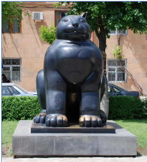
Gato de Fernando Botero