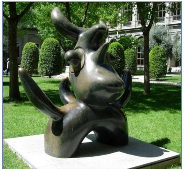
Escultura en Madrid de Joan Miró

9.- Compara estas esculturas en relación con: