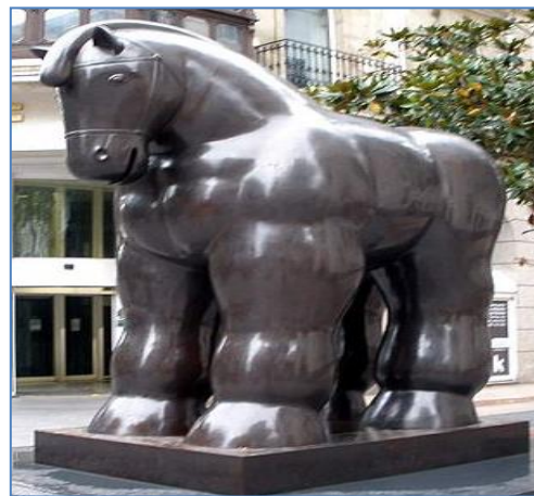
Caballo con bridas de Fernando Botero