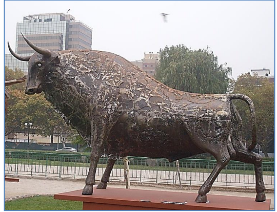
Toro de Sergio Castillo

8.- Compara ambas obras en relación con: