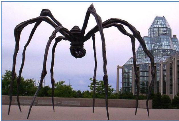
Araña en Canadá de Louise Bourgeois