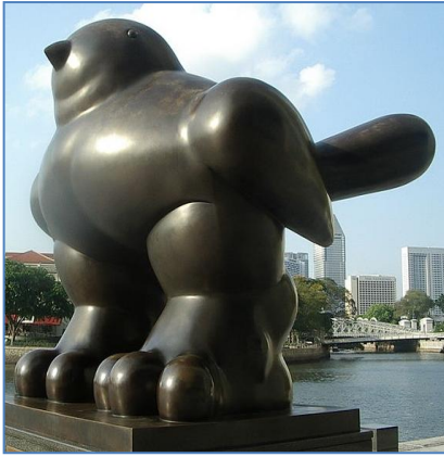
Pájaro de Fernando Botero