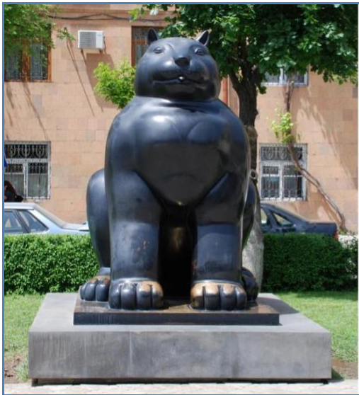
Gato de Fernando Botero