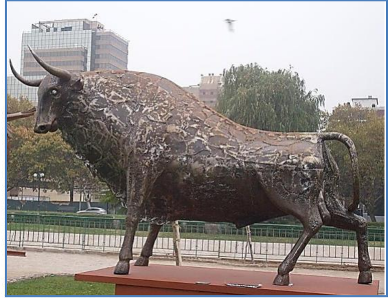
Toro de Sergio Castillo

8.- Compara ambas obras en relación con: