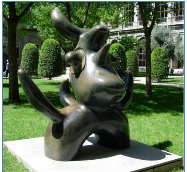
Escultura en Madrid de Joan Miró

9.- Compara estas esculturas en relación con: