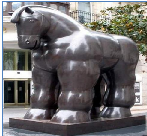
Caballo con bridas de Fernando Botero