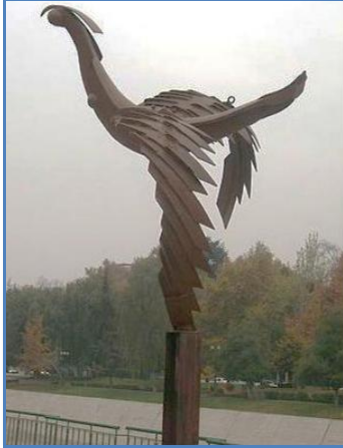
Pájaro de la noche de Sergio Castillo