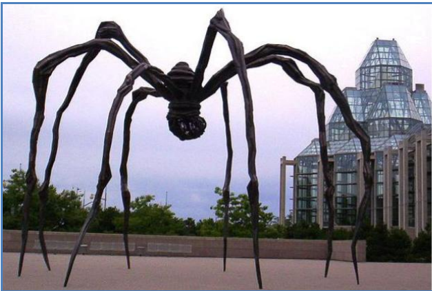
Araña en Canadá de Louise Bourgeois