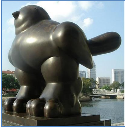
Pájaro de Fernando Botero