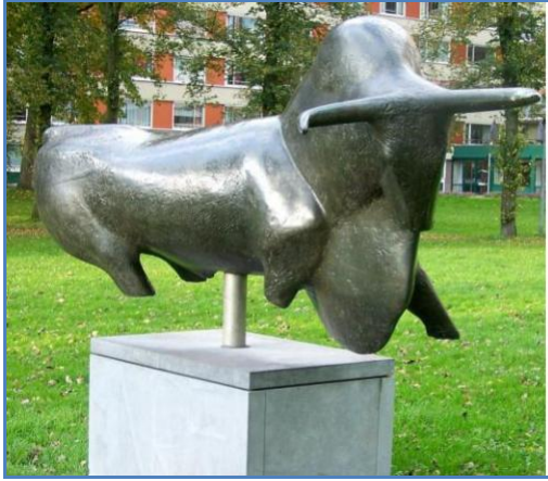
Wedina de Wien Cabbenhagen