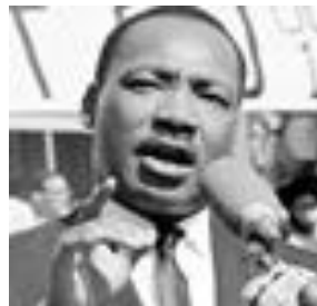
Martin Luther King

dedicó a sus alumnos del colegio, distinguiéndose por ser un gran educador de juventudes. Tras ver las necesidades, miserias y enfermedades que le rodeaban, fundó "El Hogar de Cristo", una fundación dedicada a los más necesitados. Fue, además, fundador de la Acción Sindical Chilena. El Papa Juan Pablo II lo beatificó en 1994. Posteriormente, el 23 de octubre de 2005, fue canonizado por el Papa Benedicto XVI.