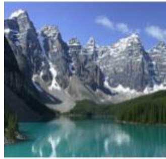
Montañas rocosas Colorado.