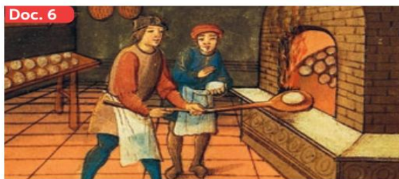
▲ Maestro panadero y su aprendiz. Oxford, Inglaterra (siglo XV).

La mayoría de la población de los burgos eran trabajadores artesanales y tenderos, que vivían en muy malas condiciones; luego estaban los profesionales o grupos medios (médicos, abogados, comerciantes) y una minoría rica y poderosa (banqueros, grandes comerciantes, dueños de talleres, nobles y obispos). Los banqueros, en particular, vieron crecer su influencia y fortuna a través del crédito. Otra característica de la Baja Edad Media fue la especialización laboral. En esta época surgieron innumerables oficios artesanales como el de panadero, carpintero, zapatero o tejedor. Todos ellos funcionaban organizados en talleres y para ejercer como tales requerían largos años de práctica y aprendizaje mediante una relación de maestro-aprendiz (Doc. 6).