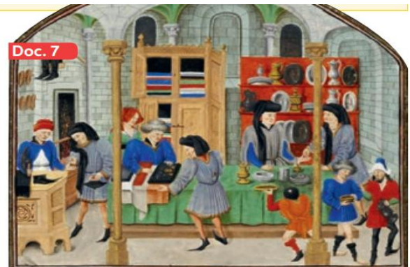
Mercado Medieval. Ruan, Francia (siglo XV)

A partir de la lectura anterior y la observación de las fuentes visuales responde las siguientes preguntas: