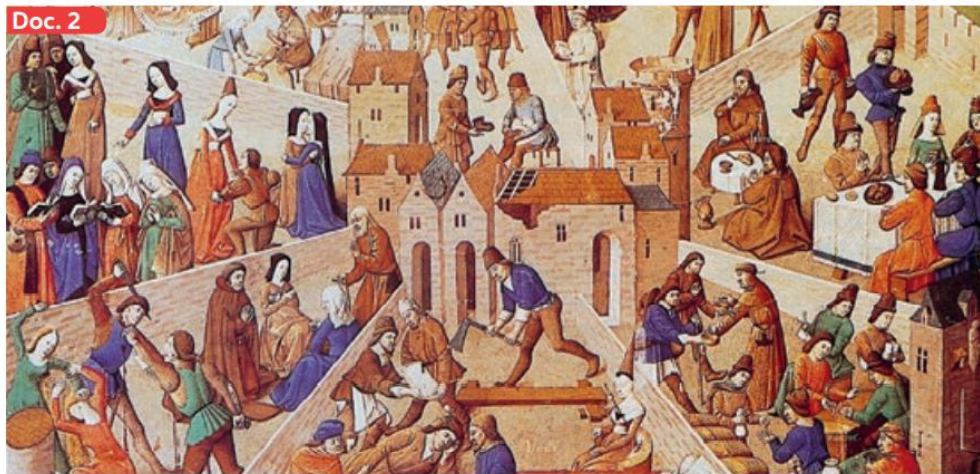
◀ Ilustración medieval del siglo XV sobre la obra de San Agustín, La ciudad de Dios .

La mayoría de la población de los burgos eran trabajadores artesanales y tenderos, que vivían en muy malas condiciones; luego estaban los profesionales o grupos medios (médicos, abogados, comerciantes) y una minoría rica y poderosa (banqueros, grandes comerciantes, dueños de talleres, nobles y obispos). Los banqueros, en particular, vieron crecer su influencia y fortuna a través del crédito. Otra característica de la Baja Edad Media fue la especialización laboral. En esta época surgieron innumerables oficios artesanales como el de panadero, carpintero, zapatero o tejedor. Todos ellos funcionaban organizados en talleres y para ejercer como tales requerían largos años de práctica y aprendizaje mediante una relación de maestro-aprendiz (Doc. 6).