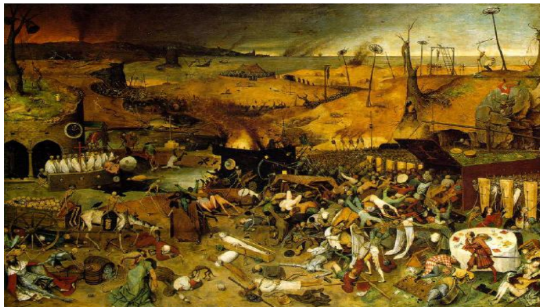
El triunfo de la muerte, Giacomo Barlone de Buschis (1485)

.- Observa la siguiente fuente visual y responde la pregunta 8