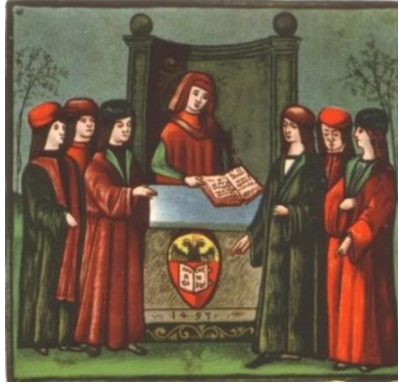
Miniatura que muestra a un grupo de alumnos de la Universidad de Bolonia (siglo XV)

7. La imagen de Miniatura que muestra a un grupo de alumnos de la Universidad de Bolonia se vincula con la idea de: