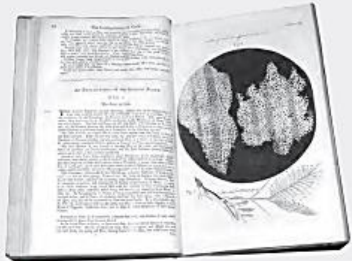
▲ Hooke en realidad observó los restos de las paredes de células muertas del corcho.

Pese a que Hooke acuñó el término célula en el campo de la biología en 1655, pasaron muchos años antes de que tuviera el significado de unidad estructural y funcional de los seres vivos. El cambio se logró gracias a los aportes de las investigaciones de otros científicos.