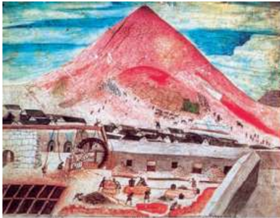
Doc. 2 Representación de las minas de Potosí (actual Bolivia). Fue uno de los centros de extracción de plata más importantes de la Colonia. En ellas se practicó la mita y en sus faenas, miles de indígenas murieron aplastados o ahogados.

La mita fue un sistema de trabajo por turnos creado por los Incas, antes de la llegada de los españoles. Sin embargo, tras el fin del imperio Inca, la mita fue adoptada por los conquistadores. En este sistema un grupo de indígenas era llevado por un período de tiempo, a trabajar principalmente en las minas de oro y plata. Las condiciones de trabajos eran inhumanas, pues los hombres debían trasladarse a minas alejadas de sus pueblos y cargar metales extraídos en sus espaldas