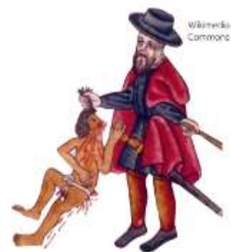
Lord Kingsborough (1836). "Indígena maltratado por un encomendero". En Códice Kingsborough.

En la encomienda los indígenas fueron considerados súbditos de la Corona, y como tal, debían pagar tributos. Este sistema de trabajo consistía en la entrega de indígenas (encomendados) a un español (encomendero). El encomendero podía emplearlos como mano de obra y a cambio debía educarlos, protegerlos y evangelizarlos, pero como ya sabes el sistema dio pasos a abusos.